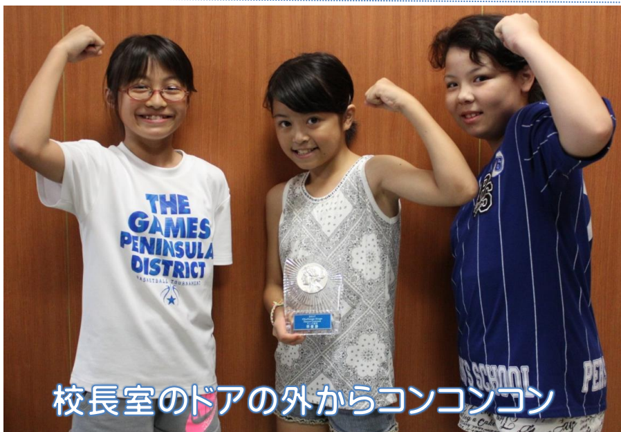
校長室のドアの外からコンコンコン

校長講話「ザ・学校」シリーズが始まりました。今回は、普段授業で行っていることの積み重ねについて考えてもらいました。講話10分、感想のメモ5分という限られた時間の中での学習です。一年間をかけてのシリーズです。詳細は本校ホームページをご覧ください。