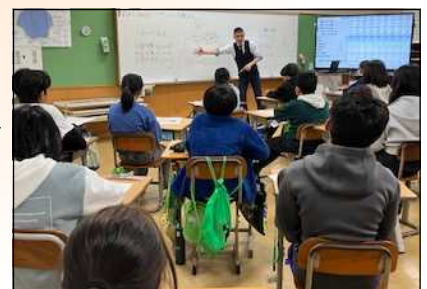
考えを出し合って 解き方を検討