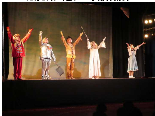
1月12日（木）オズの魔法使い観劇