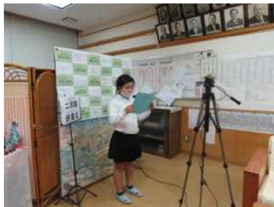
12月23日（金）二学期終業式