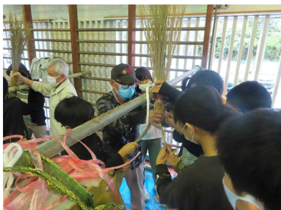
12月21日（水）5年生しめ縄づくり