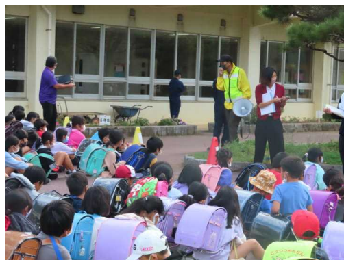
12月14日（水）緊急集団下校