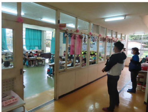
12月6日（火）授業参観・学級懇談会