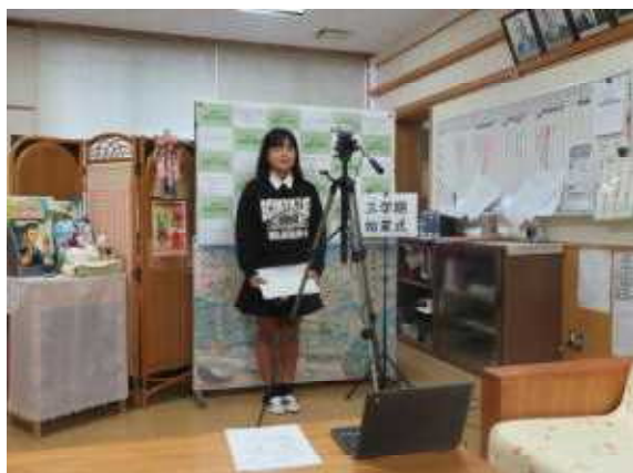
1月6日（木）三学期始業式