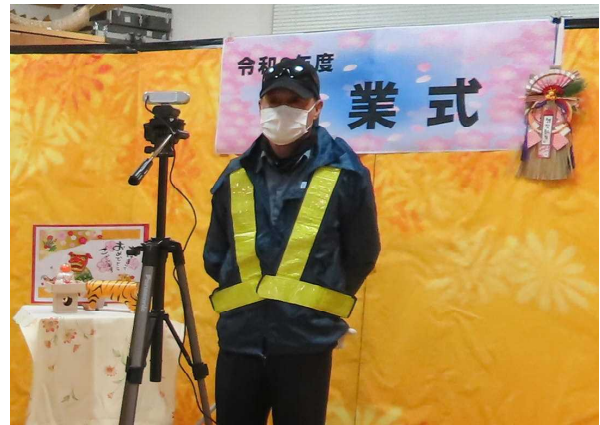
1月6日（木）Tさんの後任にIさんが就任しました