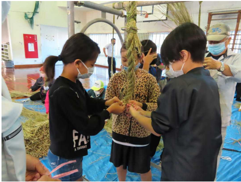
12月14日（火）5年生しめ縄づくり