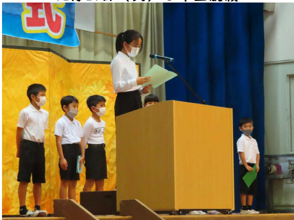
12月24日（金）2学期終業式