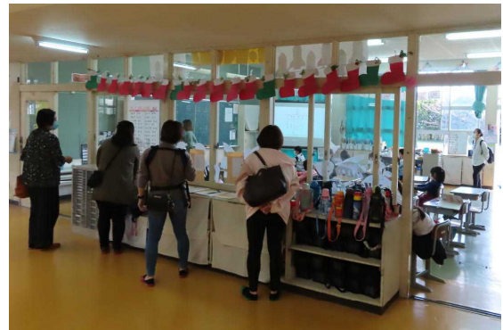
12月14日（火）授業参観・学級懇談会