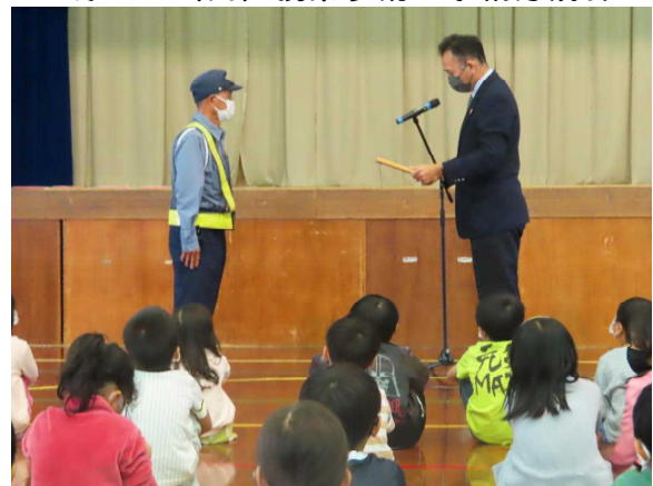
12月22日（水）Tさん地区健康教育研伝達表彰