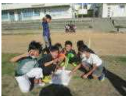
2月4日 新潟県から雪届く