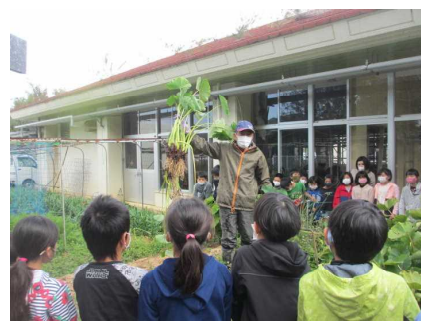
19日 田イモ収穫体験