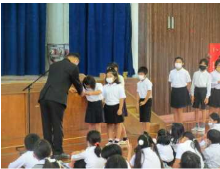
12/25 がんばりノート の表彰