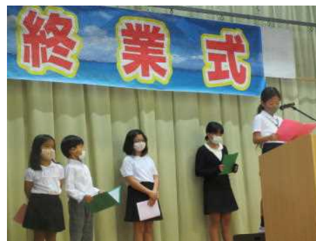
12/25 終業式で2学期 頑張った事の発表