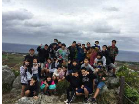
6年生 12/18 修学旅行で 伊江島と美ら海水族館 に日帰りで 行きました。