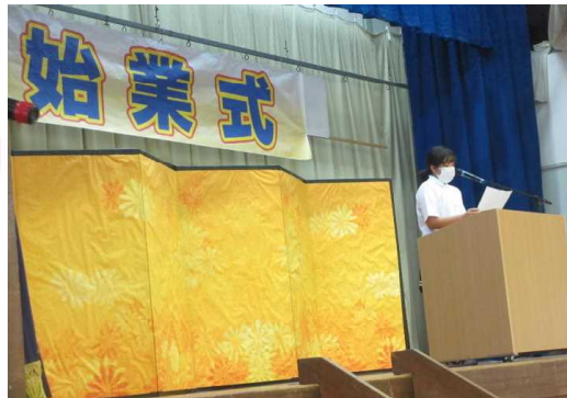
1/6 始業式で3学期の 心構えについて 発表する児童会代表

「ほめる」とは、 子どもを評価すること ではありません。 子どもががんばり、 成長を見つけて、 その喜びを伝えていく ことです。