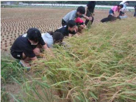
5年生 12/7に稲刈り 12/21は脱穀を 行いました。