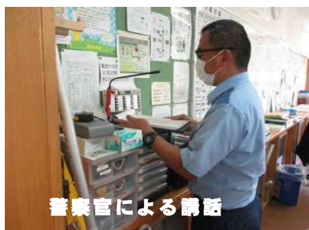
警察官による講話

石川警察署の方に講評をいただき、児童はワークシートで訓練の振り返りを行いました。学校を出ても登下校中の不審者への注意、交通事故、火事、海・川の事故、地震、津波、大雨、台風の時など、「かけがえのない大切な命を守る行動」ができるようにしましょう。ご家庭でも危険回避について話題に取り上げ大切な命を守っていきましょう。