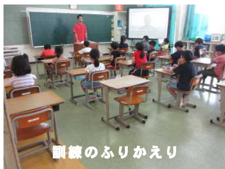
訓練のふりかえり