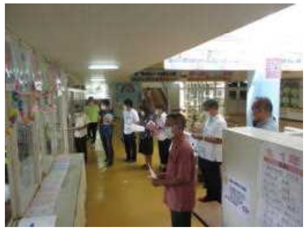
6月25日(木)教育委員会訪問の様子