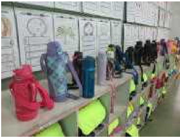
子どもたちの水筒

コロナ対策をとりつつ、それ以上に熱中症対策を意識して日々の学習活動が行われています。