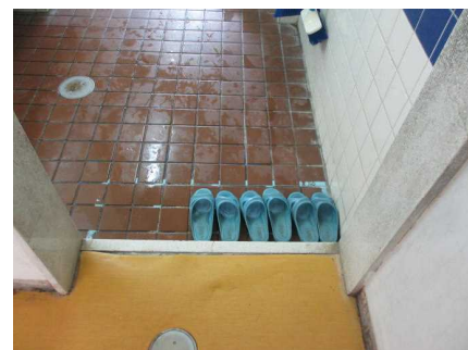
整然としたトイレのスリッパ