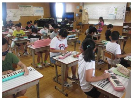
座席の向きを工夫した音楽の授業