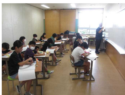
少人数での算数指導