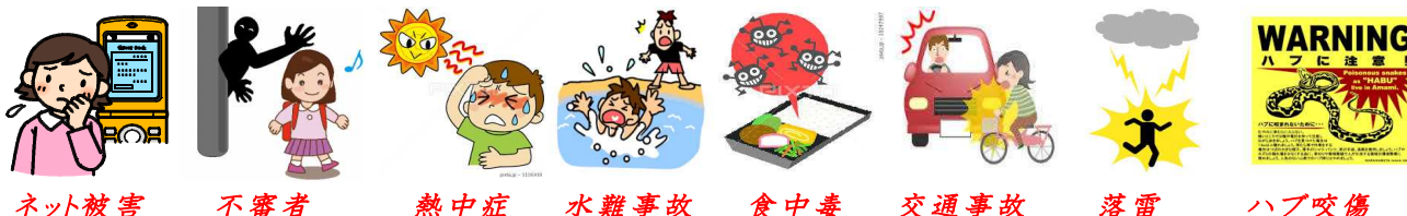
ネット被害 不審者 熱中症 水難事故 食中毒 交通事故 落雷 ハブ咬傷

平成から令和の時代にかけて、社会、生活スタイル、気象が速度を増して変化しているように感じます。いつの日からか学校には水筒持参で登校するのが慣習となり、体育の時間には、給水タイムを設けることもあります。熱中症対策の1つの方法です。暑い日の“危険”では、ハブ、落雷、洪水、水難事故、食中毒などがあります。人災、天災、危険はいつ何時やってくるか分かりません。本校でも、情報モラル、火災、地震、津波、不審者等の避難訓練を実施しています。ご家庭でも 危機回避の方法 や 心構え について話題にしていただければと思います。