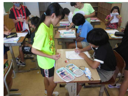
授業中友達と学び合い