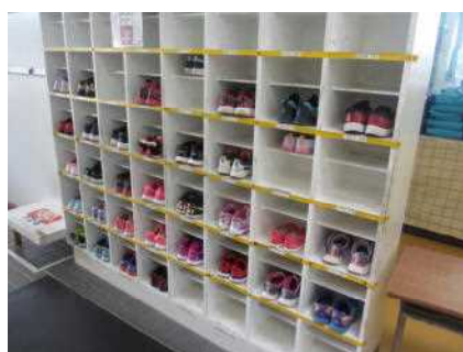
きっちと収まる靴箱