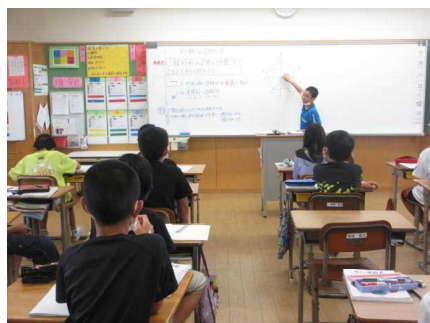
自分の考えを発表

北部ではイジユの花が咲き、本県の梅雨入りが発表されて約ひと月ほど経ちました。湿度が上がり蒸し暑い日が続いていますが、子どもたちは元気に登校し、「知」「徳」「体」に関わる様々な教科学習、行事活動を行っています。日々の学校生活をとおして、毎日、少しずつ、一步一步着実に成長しています。