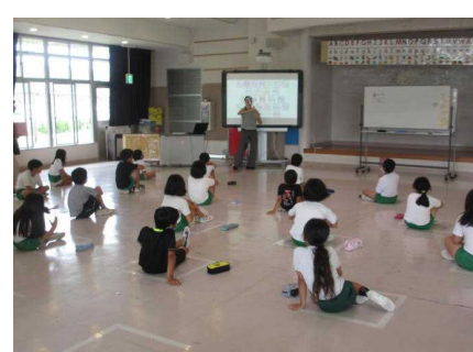
個々の距離をとっての外国語活動