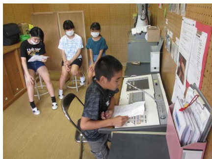
放送による委員会発表